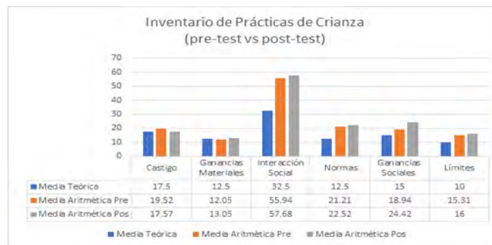
Figura 1. Inventario de prácticas de crianza