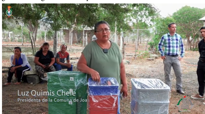
Figura 5. Entrega de tachos separadores de residuos sólidos a la comuna

Los contenedores serán utilizados como una herramienta educativa para reforzar los conceptos impartidos durante las capacitaciones, permitiendo a los habitantes aplicar directamente las técnicas aprendidas sobre la gestión de residuos. Esta fase es clave para evaluar, en un futuro, cómo la comunidad asimila y aplica los conocimientos adquiridos sobre la correcta disposición de los residuos.