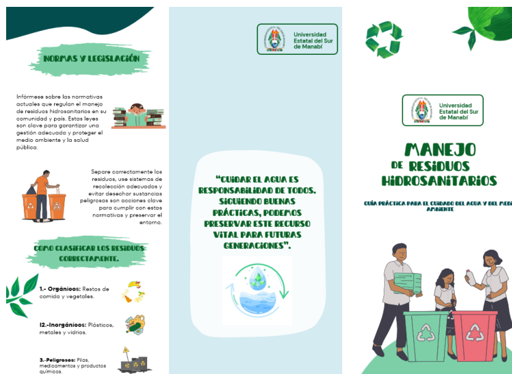
Figura 3. Material educativo, tríptico.