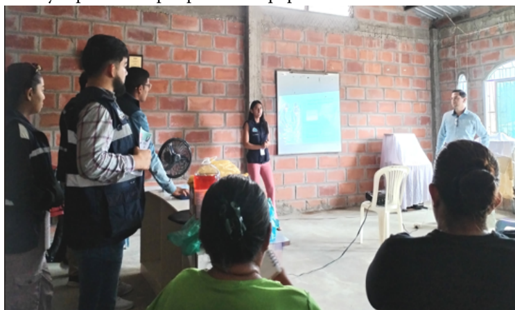
Figura 1. Charla y capacitación por parte del equipo del área de Vinculación a la comunidad