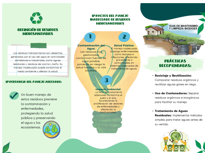
Figura 2. Material educativo, tríptico.