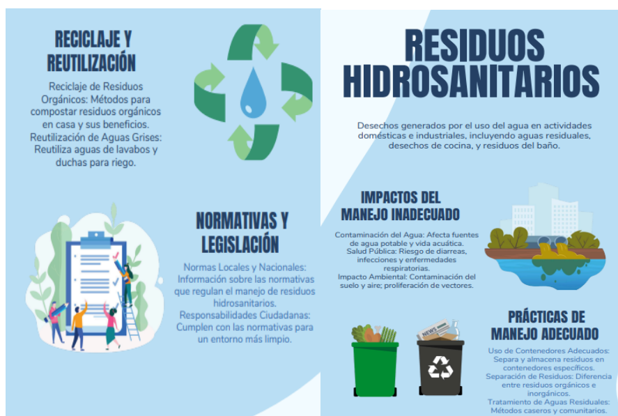
Figura 4. Material educativo, folleto.