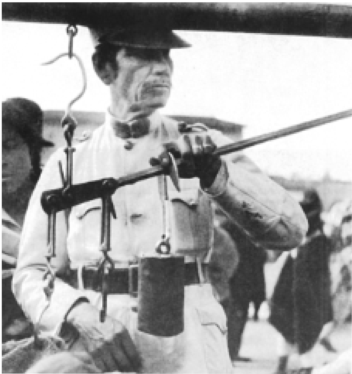
Policía municipal: juez de pesas