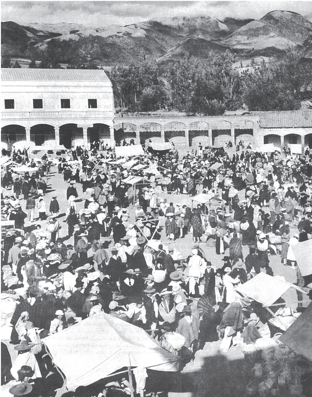
Mercado viejo de Otavalo

Fuente: Tomado del libro "Valle del Amanecer" autores Aníbal Buitrón y John Collier, Jr. Biblioteca Cincuentenario Instituto Otavaleño de Antropología (IOA)