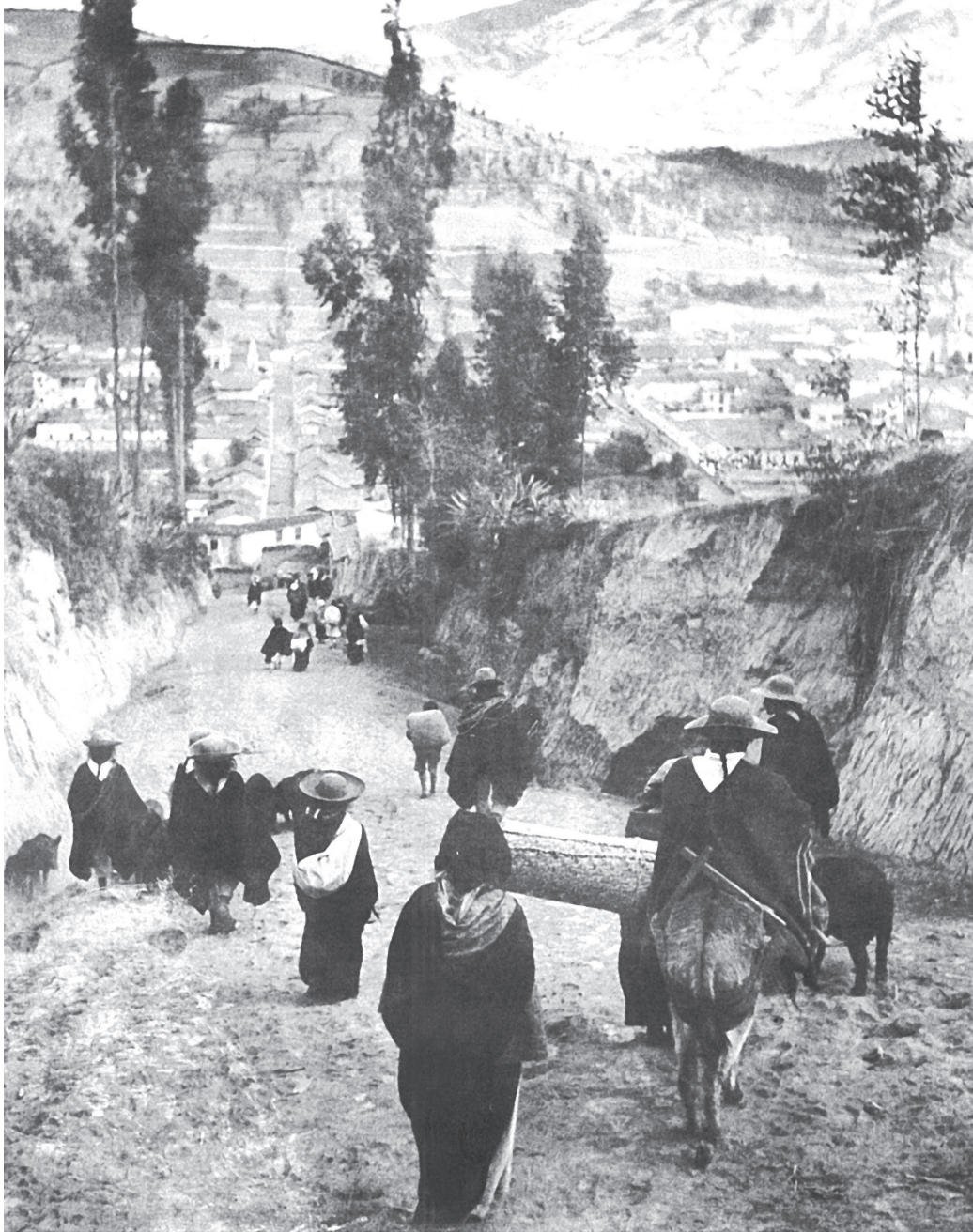
Camino al Valle de Otavalo