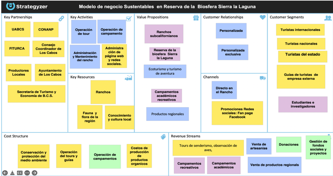
Figura 3. Modelo de negocio sustentable en Sierra La Laguna, Baja California Sur, México.

Por último, la estructura de costes (EC) está basada en un modelo de negocio de valor, en tres ámbitos: a) gastos operativos, b) gastos del programa de manejo y conservación del medio ambiente y c) gastos de operación de tours y guías, d) operación de campamentos y costos de producción de productos orgánicos.